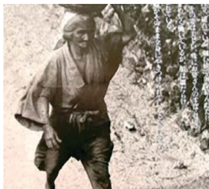
Bewohner von Okinawa.

Die Koralle wurde in Europa als Medizin der westlichen Welt erstmals durch die arabische Expansion des 9. Jahrhunderts eingeführt. Der persische Philosoph Al-Kindi bezog die Koralle in die «Medizinische Formel» (830 A.D.) mit ein, welche in der arabischen Welt nach der moslemischen Umwandlung von Persien angenommen und dann während ihrer nach Westen gerichteten Kampagnen verbreitet wurde. Beweis des westlichen Korallengebrauchs kann in der ältesten Apotheke der Welt (gegründet 1685) gefunden werden, welche immer noch existiert und als Museum in Nordspanien erhalten blieb. Unter den Reihen von Flaschen auf den alten Regalen ist ein Behälter von Korallenpulver mit der Beschriftung «Die blonde Koralle ist die einzige Koralle, die für die Medizin benutzt wird.» Die Beschriftung führt weiter aus, dass die Koralle eine vorteilhafte Wirkung auf das Herz hat und den Stimmungszustand der Person erhöht, welche sie einnimmt.